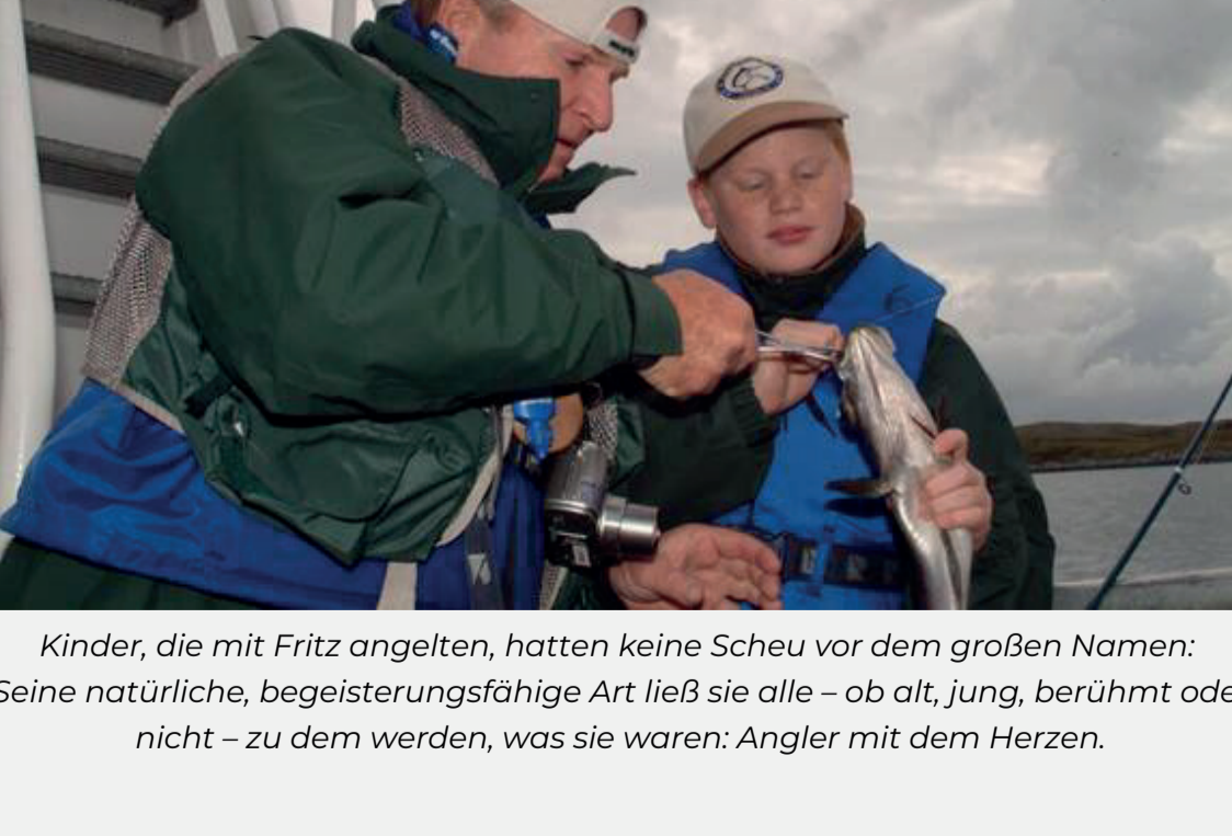
Kinder, die mit Fritz angelten, hatten keine Scheu vor dem großen Namen: Seine natürliche, begeisterungsfähige Art ließ sie alle – ob alt, jung, berühmt oder nicht – zu dem werden, was sie waren: Angler mit dem Herzen.