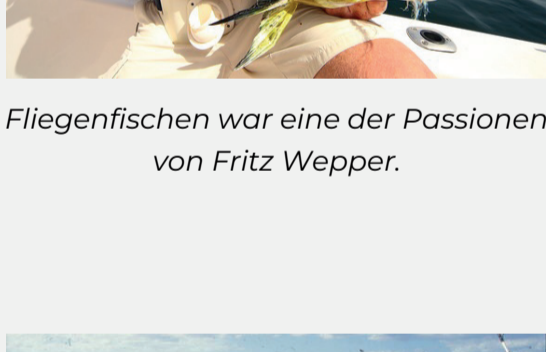
Fliegenfischen war eine der Passionen von Fritz Wepper.