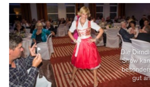
Die Dirndl-Show kam besonders gut an.