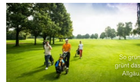
So grün grünt das Allgäu.