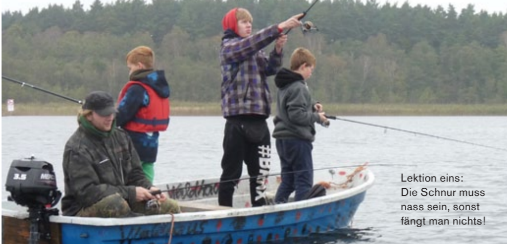
Lektion eins: Die Schnur muss nass sein, sonst fängt man nichts!

„Wir möchten uns sehr herzlich für die Angelsafari im Oktober in Neu Canow bedanken“, schreibt die „Öffnung der Schulen e.V. Greifswald“ : „Es waren sehr ereignisreiche Tage, die wir mit Ihrer Unterstützung erleben durften. 13 Schüler, die in den letzten beiden