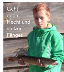
Geht doch: Hecht und stolzer Fänger.

Unverhofft kommt oft: Auf Barsch geangelt, Brassen gefangen.