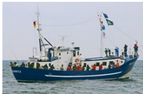
Die „MS Rügenland“ fährt den reichen Dorschgründen entgegen.

See ( www.hochseeangeln-ruegen.de ), für die Boddengewässer hat Siggi quasi alle Boote und Guides der Gegend verpflichtet, die vom Hafen in Breege losfahren, um die reichen Rügäner Raubfischgründe abzugrasen.