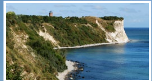
Nach Rügen geht's zum nächsten Jugendangeln, auf Meeresfische und Brackwasser-Räuber. Fest eingeplant ist ein Ausflug zum Kap Arkona.