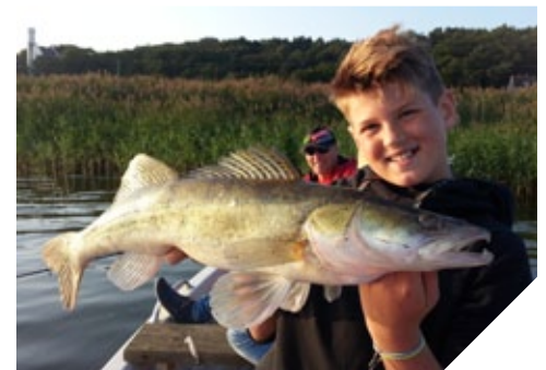
In den Boddengewässern leben auch Zander, Hecht und Barsch.