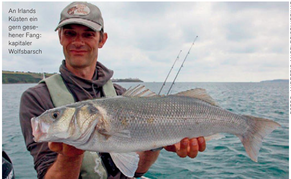
An Irlands Küsten ein gern gesehener Fang: kapitaler Wolfsbarsch