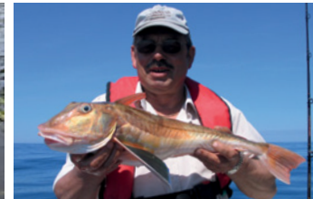
Die Vielfalt des Atlantik - von Pollack (links) bis Knurrhahn. Und in die Flüsse steigen Lachse auf (Mitte).