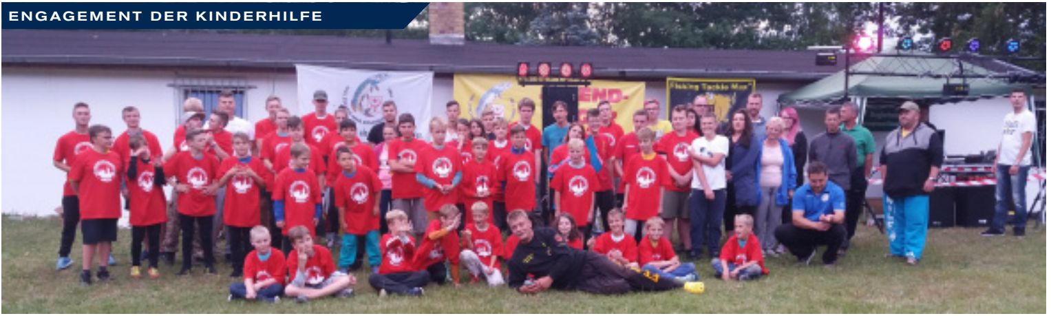
Super Stimmung und „die beste Zeit des Lebens“: Die AWO Halle ist mit Jugendlichen zum Angelcamp an den Muldestausee gefahren.