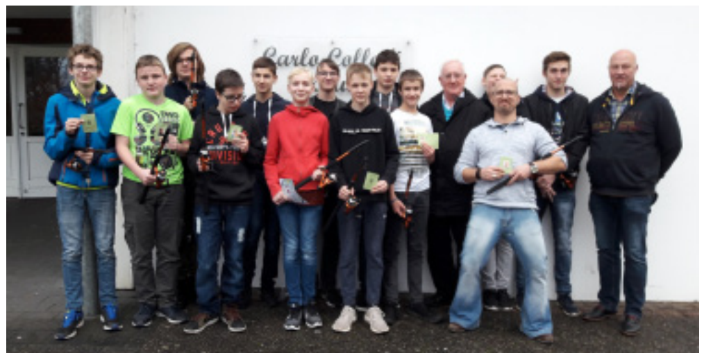
Elf Mal neues Anglerglück an der Carlo-Collodi-Schule ins Linswege.

Ende November haben 11 Schüler der Carlo-Collodi-Schule in Linswege im Oldenburger Land ihre Sportfischerprüfung bestanden. Die Ausbildung wurde mit Hilfe von Royal Fishing finanziert. Die Schule schreibt uns: „Mit Ihrer Hilfe können nun diese Schüler ein neues Hobby erkunden, in Vereine eintreten, neue Sozialkontakte knüpfen und sich auf eine neue und schöne Art und Weise in die Gesellschaft einbinden. Wir sagen: DANKE SCHÖN für Ihr Engagement, Ihre Unterstützung in Rat, Tat und natürlich auch in finanzieller Hinsicht. Die Zusammenarbeit mit Ihnen bedeutet für uns eine wertvolle Kooperation und ist ein Gewinn. Unseren Schülern können wir so eine weitere Perspektive schaffen im Hier und Heute und auch in ihrer Zukunft.“