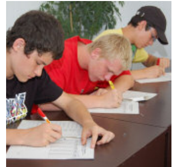
Jetzt bloß keinen Fehler machen! 17 Jugendliche stellten sich der Prüfung